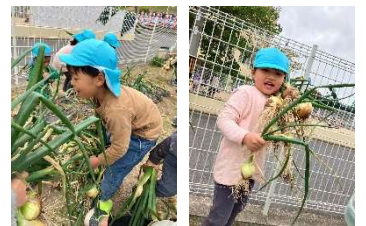
クッキングするの楽しみ 🍌🍌

ゆりぐみが昨年の11月(ひまわりぐみの時)に植えた玉ねぎが大きく実りました。収穫をととても楽しみにしていて、草抜きも頑張っていましたよ。目を輝かせながら玉ねぎ抜きを楽しみ、抜いた後は紐で結んで干すところまでみんなで協力してできました。今年は、 214玉 収穫できました。